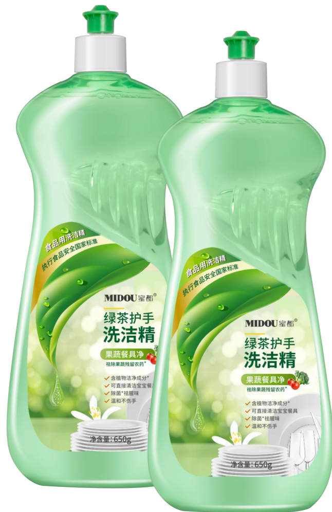
蜜都·绿茶护手洗洁精

Efficient and multi-purpose 1 bottle top multiple bottles